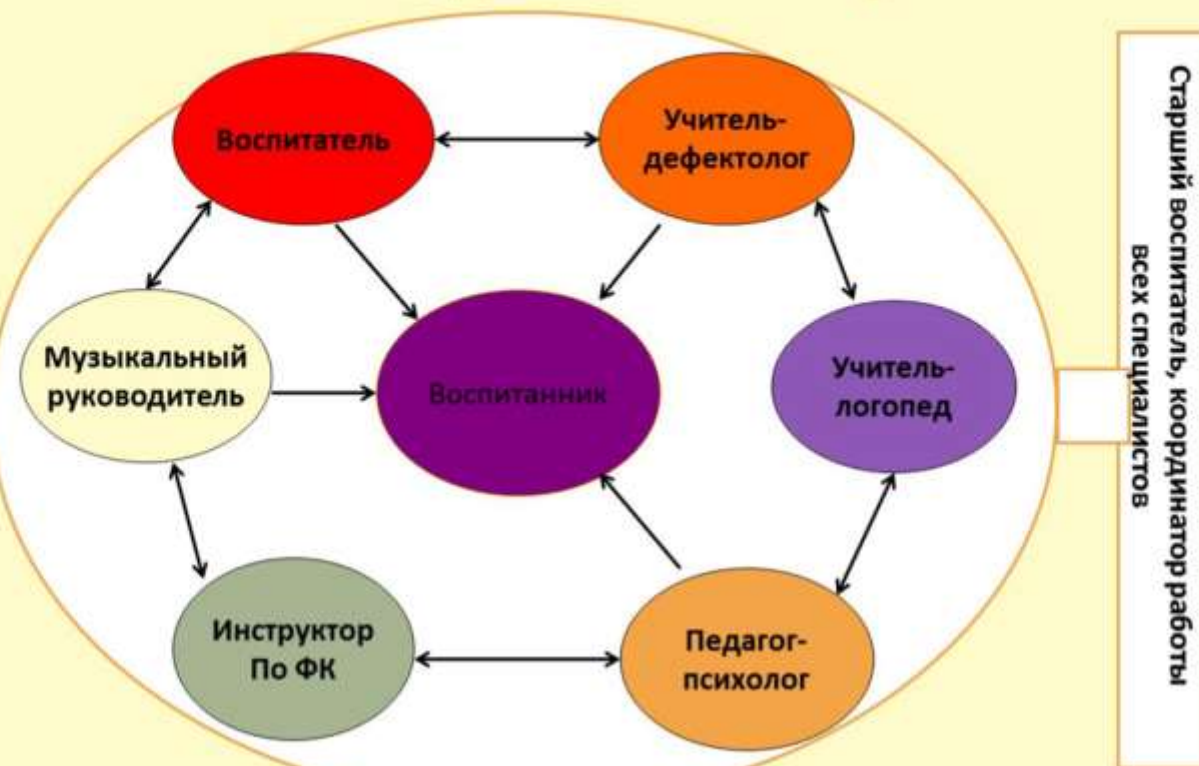
Схема взаимодействия специалистов